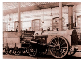
W rozwoju firmy Amélie wykorzystała rozkwit przemysłu kolejowego