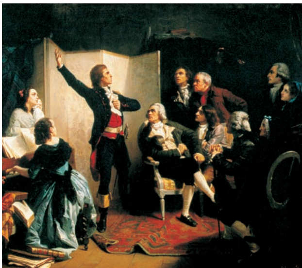
Baron De Dietrich zlecił napisanie marsza wojskowego, który stał się później hymnem Francji.