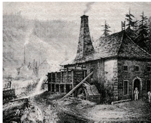
Zakład rusznikarski w Jaegerthal 1684