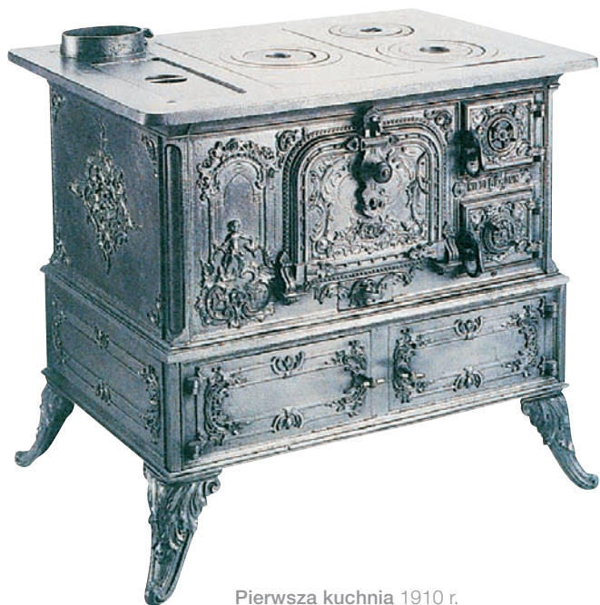
Pierwsza kuchnia 1910 r.