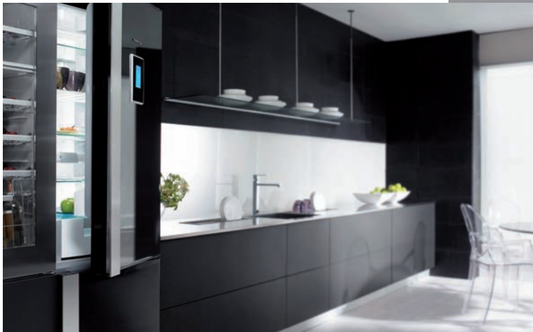
De Dietrich jest prekursorem nowoczesnego wzornictwa