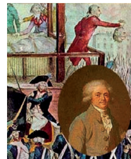
Aresztowanie i stracenie Philippe Frederic de Dietrich