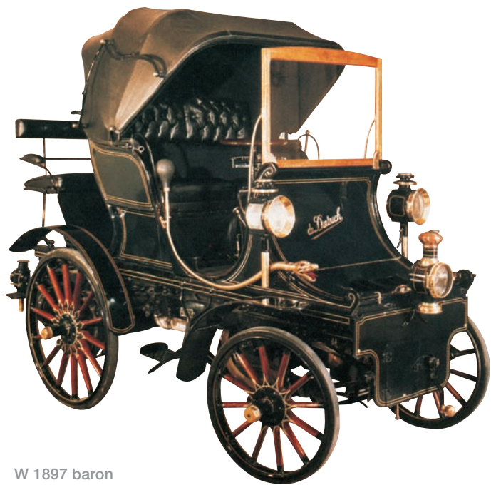
W 1897 baron Eugène De Dietrich kupił patent i wyprodukował samochód