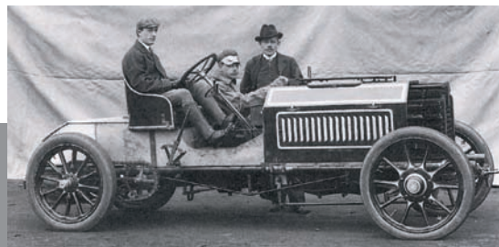
W 1902 roku powstał pierwszy luksusowy samochód De Dietrich-Bugatti