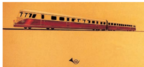
De Dietrich zaangażował się w produkcję napędzanych paliwem Diesel wagonów pociągowych.